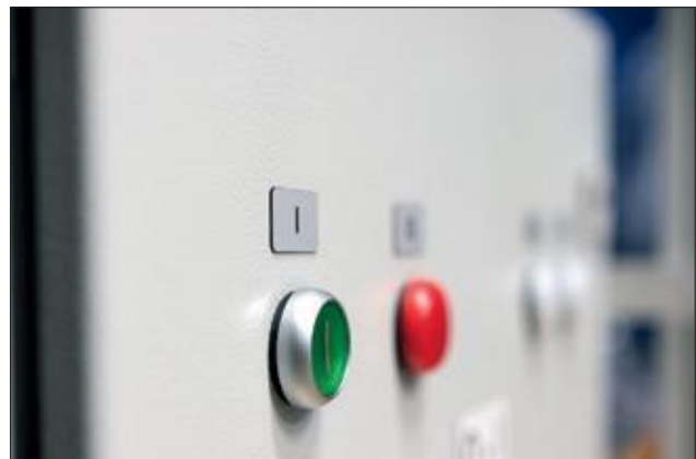
Disse etikettene kan erstatte graverte skilt.